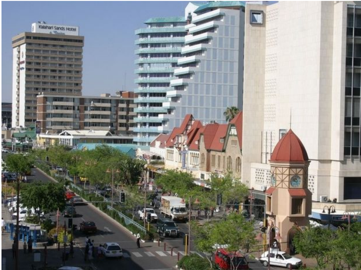
Aufstrebende Metropole. Windhoek erlebt ein enormes Wachstum.

Bratwurst) auf zu Grills umfunktionierten Einkaufswagen feilgeboten. Anlass zur Kreation des Labels „Dolce & Kapana“ – eine Werbung für das den Touristen bisher weitgehend unbekannt Windhoek.