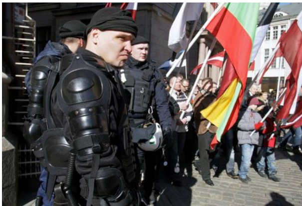
Polizei schützt Aufmarsch lettischer SS-Veteranen in Riga.

»Solche Taten«, heißt es in dem Offenen Brief der Juristen, »hat es überall in Europa gegeben, wo antifaschistischer Widerstand geleistet wurde, nur dass sie in diesem Fall fünf Jahrzehnte später Kononow zur Last gelegt wurden.«