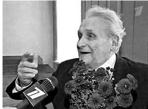
Wassilij Kononow

Kononow ist als Teilnehmer an einem Gerichtsprozess gegen die Behörden Lettlands bekannt, die ihn der Ermordung von friedlichen Bürgern im zweiten Weltkrieg beschuldigten, als er einen Partisanentrupp kommandierte. Kononow selbst behauptete, dass diese Menschen Helfershelfer von Faschisten waren und nach dem Urteil eines Tribunals hingerichtet wurden.