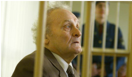
Wassilij Kononow

Der ehemalige sowjetische Partisanen-Kommandeur Wassili Kononow war Ende der 1990-er Jahre von einem lettischen Gericht wegen der Tötung lettischer Nazi-Kollaborateure während des Zweiten Weltkrieges schuldig gesprochen worden. Von 1998 bis 2000 saß er hinter Gittern. Nach mehreren Prozessen in Lettland verhandelte eine kleine Kammer des Gerichtshofes in Strasbourg diesen Fall. Sie sprach Kononow frei und gab 2008 einer Entschädigungsklage gegen Lettland statt. Die lettische Justiz focht diesen Freispruch an. Der Fall wurde an die Große Kammer in Strasbourg verwiesen, die nun zugunsten Lettlands entschied.