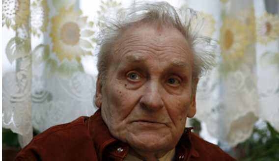
Vasily Kononov

A former Soviet partisan, Vasily Kononov, has died in Riga aged 88. When a Latvian court earlier found Kononov guilty of war crimes during World War II Russia issued a protest, granted Kononov Russian citizenship and acted as a third party in court.