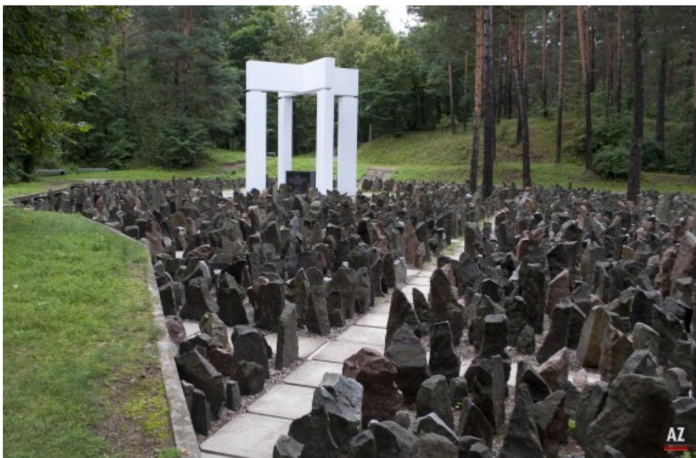
Gedenkstätte im Wald von Bikernieki

Billerbeck. Sieben Monate nach der Namensgebungsfeier machten sich jetzt Schüler, Eltern und Lehrer der Geschwister-Eichenwald-Realschule Billerbeck auf den Weg nach Riga, um einen Eindruck von der Gegenwart und der Vergangenheit der lettischen Hauptstadt zu gewinnen.