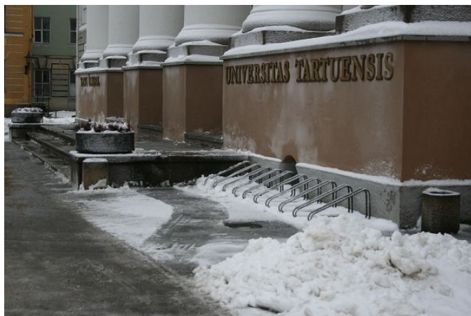
Universitas Tartuensis / Universität Tartu

Die Lage der russischsprachigen Bevölkerungsgruppe in Estland ist bei vielen, die von außen auf die Vorgänge der kleinen Republik am Finnischen Meerbusen schauen, ein Stein des Anstoßes. Solange der Besucher die Tallinner Innenstadt nicht verlässt, könnte er den Eindruck