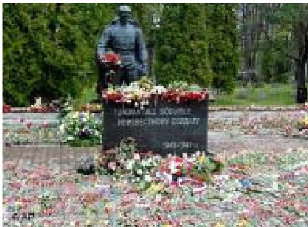
Gedenkstätte an neuem Ort