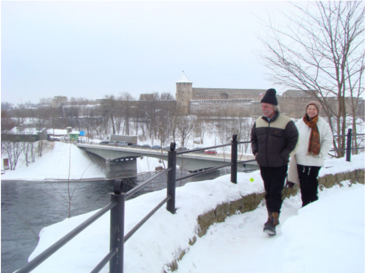
Die Russenburg im Blick: An der estnischen Ostgrenze in Narwa

Wer von Narwa über den Fluss schaut, zur alten Russenburg Iwangorod, der erfasst gleich, dass das hier kein Platz für Angsthäsen ist. Am linken Ufer, in der Festung Narwa eben, hat sich im Laufe der Jahrhunderte immer wieder der „Westen“ festgesetzt, von deutschen Ordensrittern über Dänen und Schweden bis zu den estnischen Grenzbeamten der Gegenwart. Drüben dagegen, in Iwangorod, hat sich Russland eingegraben. Der Gründer der Burg, Iwan der Große, hat mit Feuer und Schwert das Territorium des Moskauer Staates verdreifacht, Peter I. (auch er ein „Großer“ unter den Zaren) vertrieb 200 Jahre später endgültig die Schweden. Ein wenig weiter flussaufwärts haben 1242 russische Truppen ein deutsches Ordensheer vernichtet, als der Überlieferung zufolge das Eis des Peipussees unter den Panzerreitern einbrach.