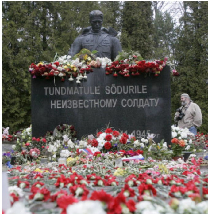
Stein des Anstoßes: Der „Bronzesoldat“ an seinem neuen Standort

Der 8. Mai ist in Westeuropa der Tag des Kriegsendes. Die nachgeholte Kapitulation im sowjetischen Hauptquartier am 9. Mai aber ist der Tag der sowjetischen Siegesfeiern. Mit dem sowjetischen Sieg aber hat Estland ein Problem: Für die Esten war es kein Tag der Befreiung. Mit dem Einmarsch der Roten Armee im Spätsommer 1944 begann die „zweite sowjetische Okkupation“. Erstmals war das Land 1940 nach dem Hitler-Stalin-Pakt besetzt worden, von 1941 bis 1944 war es von den Deutschen besetzt.