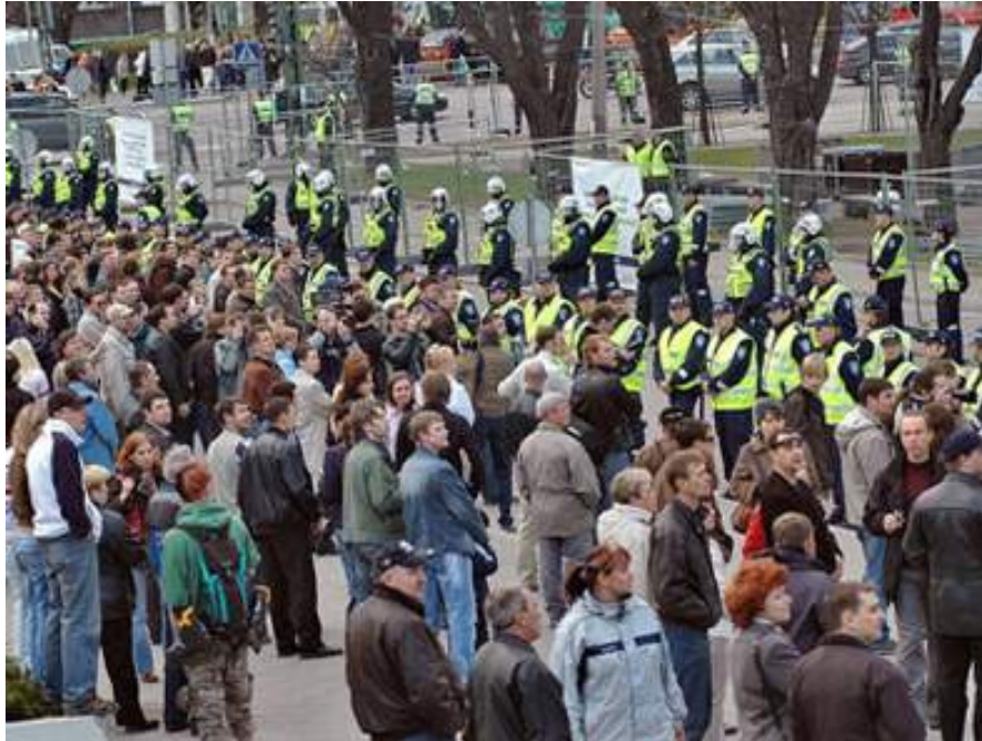
Vor einem Jahr standen sich Demonstranten und Polizei an der Stelle in Tallinn gegenüber, wo das Weltkriegsdenkmal stand. (Archiv) (Foto: dpa)

In der Folge bleiben russische Touristen in Estland aus und estnische Produkte werden in russischen Läden boykottiert. Das Internet wird durch eine Welle gezielter Hacker-Angriffe lahmgelegt, die nach Überzeugung estnischer Regierungsstellen von Russland ihren Ausgang nahmen. Das Verhältnis ist eisig geblieben. Auch im Lande selbst leben Esten und Russen eher neben- als miteinander.