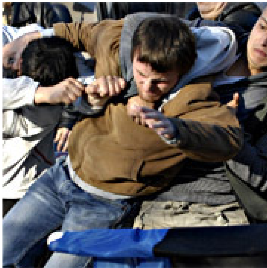
Schwere Unruhen in Tallinn

Die Lage in Estland verschärft sich: Als die Regierung mit der Exhumierung sowjetischer Soldaten in Tallinn begann, kam es zu schweren Ausschreitungen. Der russische Präsident beschwerte sich daraufhin bei der EU-Ratsvorsitzenden Merkel.