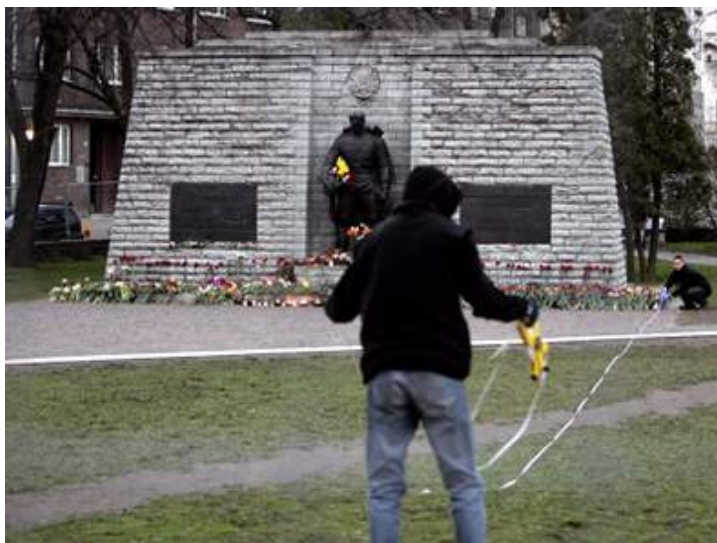
Das Denkmal für die Opfer des Zweiten Weltkriegs ist ein Symbol unterschiedlicher geschichtlicher Blickwinkel. (Archiv)

Bis heute gebe es keinen ehrlichen Dialog zwischen der Regierung und den Vertretern der Minderheit, klagt Aleksei Semjonow vom Informationszentrum für Menschenrechte: „Die Ereignisse wurden nicht analysiert, man hat die Augen verschlossen. Es gibt keinen Dialog, kein Entgegenkommen. Und das bedeutet, es gibt auch keine Sicherheit, dass sich nicht Ähnliches wiederholen kann.“