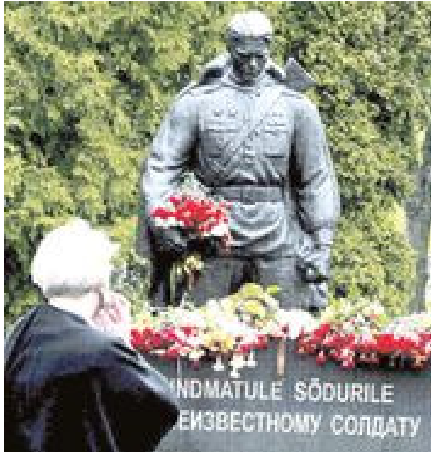
Streit ums Denkmal

Doppelzüngige «Aufarbeitung» der Vergangenheit