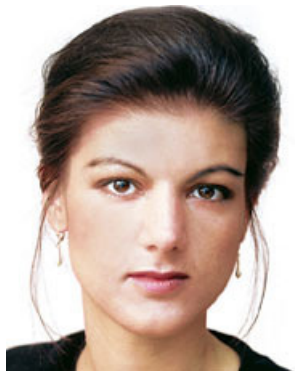
Sahra Wagenknecht MdEP

Nach ihrer Rückkehr aus Estland, wo sie den dort stattfindenden Prozess gegen die vier als Initiatoren der Ausschreitungen in Tallinn vom vergangenen April Angeklagten beobachtet und Gespräche mit den Angeklagten sowie verschiedenen Organisationen geführt hat, erklärt Sahra Wagenknecht, Mitglied des Europäischen Parlaments und des Parteivorstands der LINKEN: