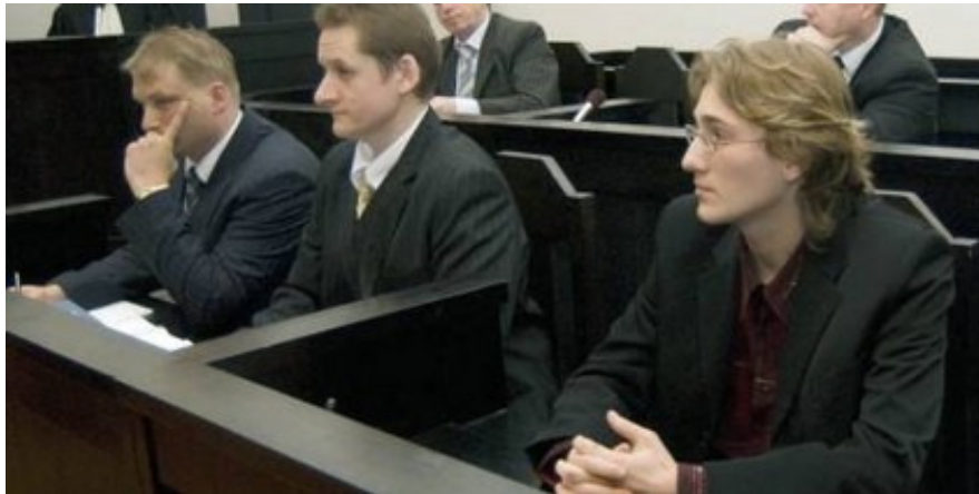
Drei der vier Angeklagten warten im Gerichtssaal auf den Prozess