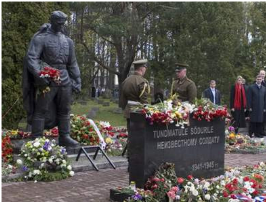
Das sowjetische Kriegsdenkmal steht heute auf einem Militärfriedhof am Stadtrand von Tallinn. (Archiv)

30 Millionen Euro will die Regierung nun für eine bessere Integration ausgeben, sagt Tanel Mätlik, der Direktor des staatlichen Integrationsfonds: „Bislang haben wir uns sehr auf den Spracherwerb konzentriert. Wir wollen aber auch persönliche Kontakte fördern und über die Kulturgeschichte unseres Landes aufklären. Es lohnt sich nicht, kostenlose Kurse anzubieten, wenn die Leute nicht motiviert sind.“