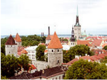
In Tallinn tobt der Kampf um die Denkmäler aus Sowjetzeit

Das Gesetz, das in erster Lesung verabschiedet wurde, verbietet den Aufbau von Denkmälern, mit denen „Staaten angepriesen werden, die Estland besetzt haben“, zitierten russische Medien aus dem Gesetzestext. Bestehende derartige Monumentalkunstwerke müssen abgerissen werden.