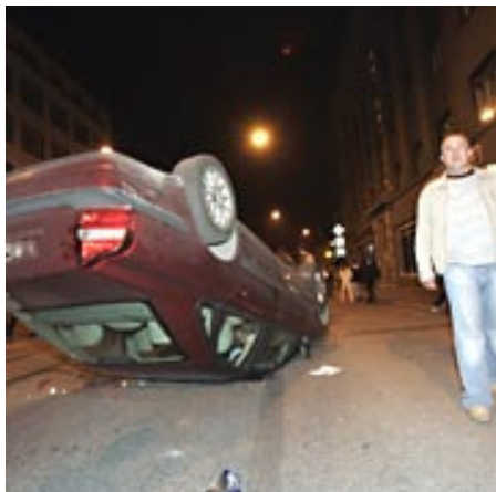
Estlands Hauptstadt Tallinn: Bei den Ausschreitungen ist ein Mensch ums Leben gekommen.

Wegen der Verlegung eines sowjetischen Weltkriegsdenkmals ist es in der estnischen Hauptstadt Tallinn zu schweren Ausschreitungen zwischen Polizei und Angehörigen der russischen Minderheit gekommen.