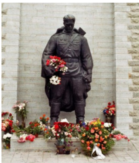
Bronze-Soldat (Tallinn)

Eine zwei Meter hohe Kopie des als „Bronze-Soldat“ bekannten Sowjetdenkmals hat in Estland für Wirbel gesorgt. Die mit Goldfarbe bestrichene Kunstharzfigur war am Samstag von der Polizei konfisziert und entfernt worden. Wie sich später herausstellte, war die Aktion Teil