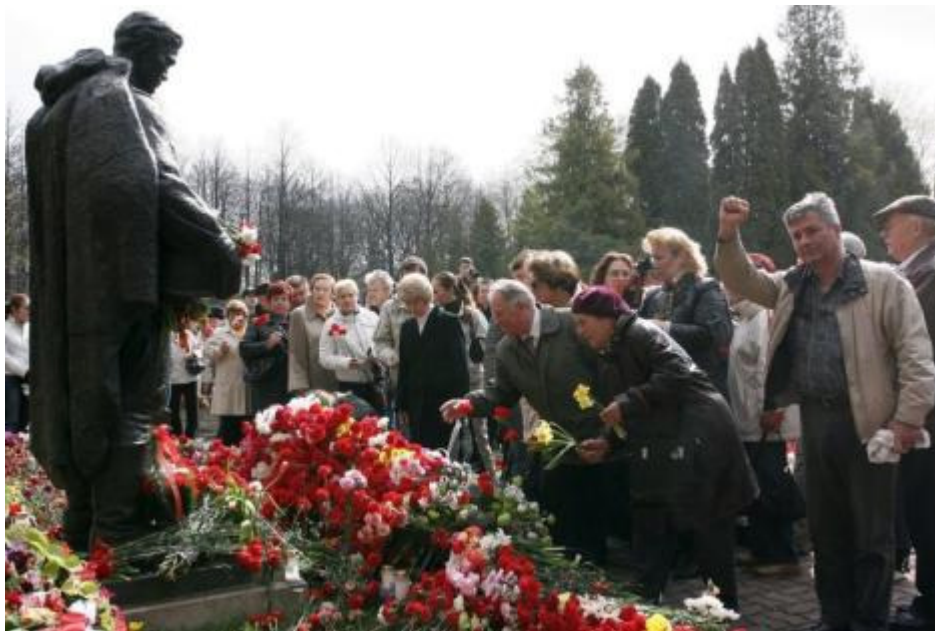
Buntes Gedenken: Zahlreiche Menschen legen vor dem „Bronzenen Soldaten“ in Tallinn Blumen nieder

Stiefmütterchen, gelbe und blaue, ein Meer von Stiefmütterchen wird von emsigen Gartenarbeitern auf dem Tönismägi-Platz in der estnischen Hauptstadt gepflanzt. Beauftragt vom Verteidigungsministerium, verwandeln Gartenbaufirmen den Platz, an dem noch bis Ende April ein sowjetisches Kriegerdenkmal stand, in einen Ort, an dem „angenehme Emotionen“ herrschen sollen. So jedenfalls drückt es eine Sprecherin des Verteidigungsministeriums aus. Heute herrschte gespannte Erwartung. Die Polizei patrouillierte bereits in der Nacht durch die Innenstadt, gemäß der Vorgabe des Polizeichefs: „null Toleranz“. Das Konzept ging auf – neue Proteste oder Ausschreitungen gab es nicht.