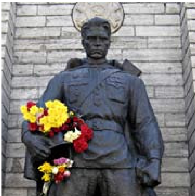
Ein Symbol sowjetischer Besatzung für viele Esten – Soldatendenkmal in Tallinn.

Soans: Einige russischsprachige Politiker haben die Organisation „Nachtwache“ gegründet, deren Mitglieder um das Denkmal patrouillierten. Die konservativen Parteien haben im Wahlkampf versprochen, das Denkmal an einem anderen Platz aufzubauen und die Leichen der Soldaten der Roten Armee, die unter dem Denkmal bestattet sind, zu exhumieren. Im Januar wurde dazu ein Gesetz verabschiedet. Moskau drohte daraufhin mit Wirtschaftssanktionen. Putin forderte, die Leichen in Russland zu beerdigen.