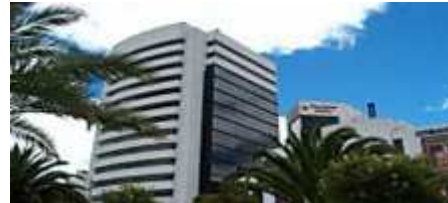
Deutsche Botschaft Quito

Ich war vor viereinhalb Jahren schon einmal hier und habe in meinen Sommerferien einen sehr intensiven Sprachkurs gemacht. Damals bin ich auf Ecuador gekommen, weil der Trauzeuge meiner Eltern eine Ecuadorianerin geheiratet hat, die mir von einer super Sprachschule erzählt hat. Ich konnte bei ihrer Familie wohnen und spanisch lernen. Der Sprachkurs war extrem intensiv, acht Stunden am Tag und so war der Aufenthalt irgendwie unvollständig und deshalb wollte ich noch mal kommen.