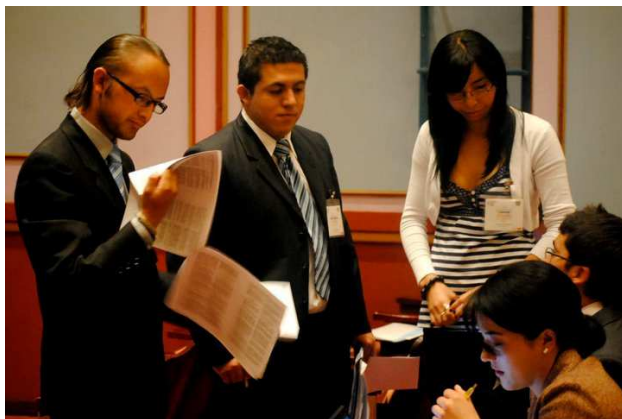
Besprechung und Verhandlungen über Gesetzestexte

Während bei formalen Sitzungen des Parlaments Laptops und Handys strikt verboten waren, wurde während der informellen Sitzungspausen auf den Gängen intensiv im Internet recherchiert und mit anderen Abgeordneten verhandelt sowie um genaue Formulierungen für neue Gesetzespassagen gefeilscht.