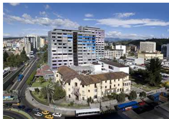
Pontificia Universidad Católica del Ecuador

Ich habe ein Semester an der Katholischen Universität studiert, dann ein Praktikum an der Deutschen Botschaft gemacht und ein weiteres Praktikum in dem Veranstaltungshaus „Casa de la Música“ absolviert, und zwischendurch einige Berge bestiegen, Akkordeon gespielt und zwei Konzerte gegeben, viele Städte und viele nette Menschen kennengelernt und ganz viele „Batidos“ (Milchshakes) getrunken.