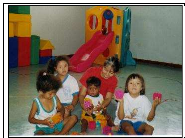
Instituto de Educación Especial Juan Pablo II, Esmeraldas

Zu den weiteren von CBM unterstützten Projekten im Land gehören eine Schule für hörbehinderte und geistig behinderte Kinder in Esmeraldas, Rehabilitationsprojekte für behinderte Menschen in den Provinzen Loja, Guayas, Chimborazo und Esmeraldas sowie ein Berufsausbildungsprogramm für Behinderte in Ambato.