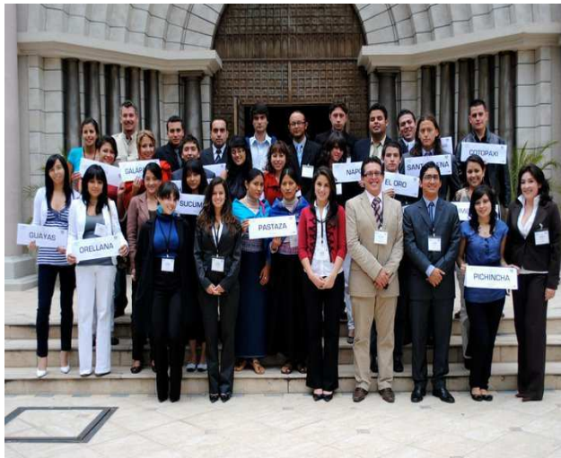
Teilnehmer der Simulation der Asamblea Nacional

Für das Jahr 2011 sind insgesamt vier Simulationen geplant, allerdings nicht ausschliesslich im Themenbereich des Parlaments. Für November 2011 ist z.B. das „Durchspielen“ eines Parteitages einer fiktiven ecuadorianischen Partei geplant.