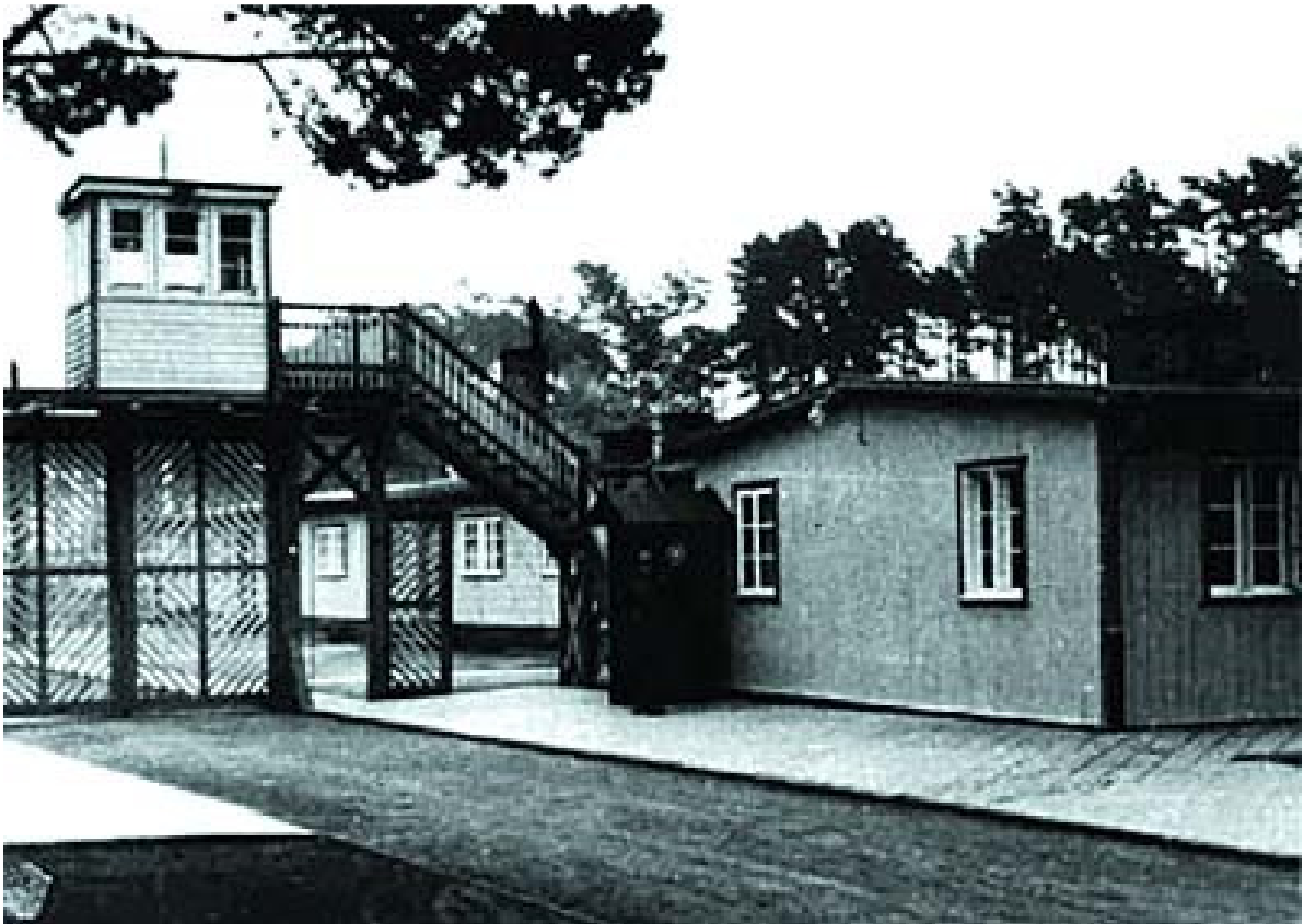
Eingangstor des KZ Stutthof auf dem Gebiet Polens

Den Krieg überlebte nur eine kleine Gruppe von Frauen, die über das KZ Jägala Ende 1942 und Anfang 1943 nach Tallinn kam. Dort wurden die Frauen z. B. zur Beseitigung von Trümmern und zu Bauarbeiten eingesetzt. Es folgten Aufenthalte in weiteren Konzentrationslagern in Estland, vor allem in Ereda und in Goldfilds. Nach der Evakuierung dieser Lager im Sommer 1944 wurden die Frauen aus Theresienstadt ins KZ Stutthof geschickt, wo sie mit den überlebenden Häftlingen aus Lettland zusammentrafen. Aber dort war ihr Weg noch nicht geendet. Eine große Gruppe von Frauen wurde zur Arbeit in eine Waffenfabrik ins Lager Neuengamme in Ochsenzoll geschickt. Von dort aus wurden sie nach Bergen-Belsen deportiert. Einige von ihnen wurden wieder zurück nach Ochsenzoll berufen. Von dort aus wurden sie noch vor Kriegsende mit einem Evakuierungstransport des Roten Kreuzes über Dänemark nach Schweden gebracht. Die Frauen, denen es gelang, die erschütternden Bedingungen in Bergen-Belsen zu überleben, wurden am 15. April 1945 durch die britische Armee befreit.