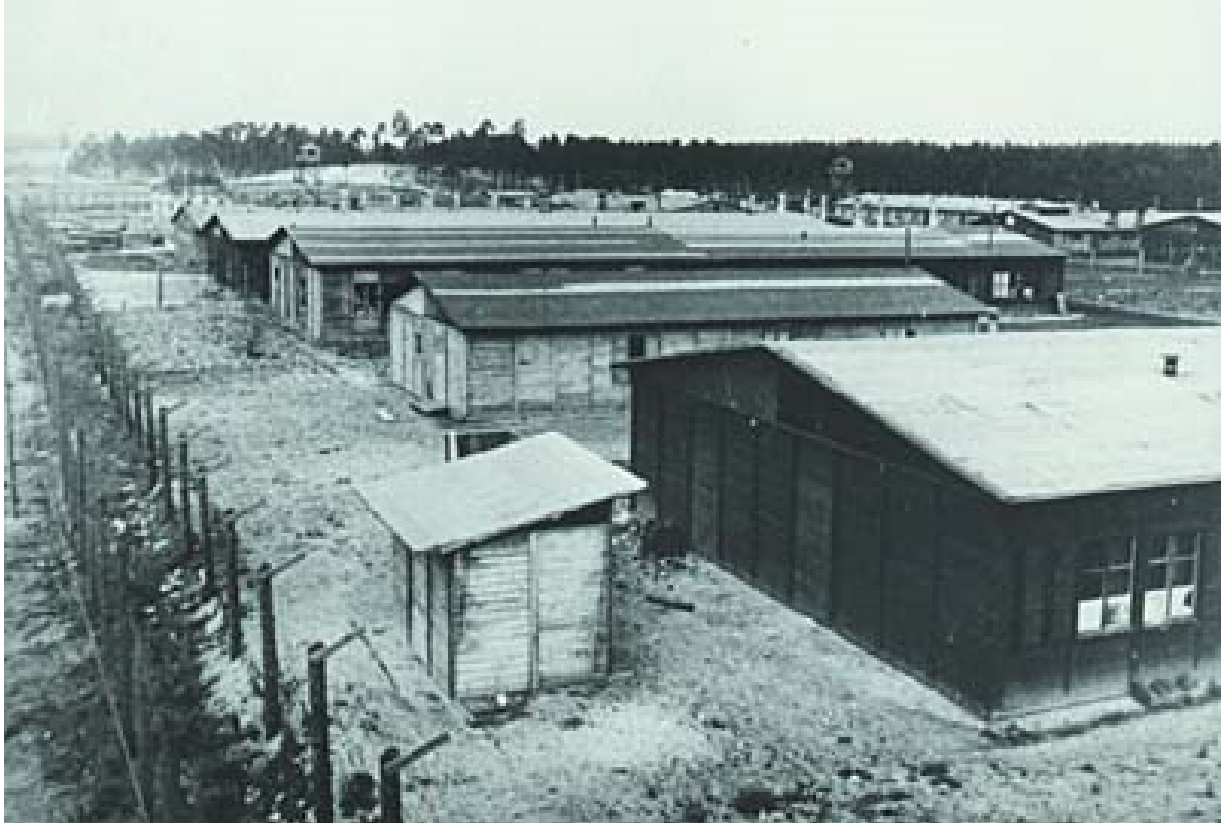
KZ Kaiserwald in Lettland

den alle Tausend Häftlinge damals gleich nach ihrer Anreise ermordet. Der zweite Transport, dessen Zielstation ursprünglich auch Riga sein sollte, wurde weiter nach Estland geschickt, da das Ghetto in Riga angeblich überfüllt war. Auf dem kleinen estnischen Bahnhof Raasik wurde die sog. Selektion durchgeführt, und die Mehrheit der Menschen musste sich in Busse setzen. Auf der Sandebene, genannt Kalevi Liiva, wurden alle Männer, Frauen und Kinder gezwungen, sich auszuziehen und alle Wertsachen abzugeben. Danach wurden sie vor den vorher ausgegrabenen Massengräbern erschossen.