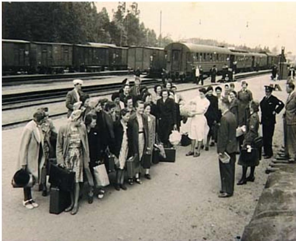
Mädchen vom Transport „Be“ während des Erholungsaufenthaltes in Schweden, Sommer 1945

Die Ausstellung befasst sich mit den Transporten, die das Ghetto Theresienstadt vor dem 26. Oktober 1942 verließen – also in der Zeit, bevor die Juden aus Theresienstadt ins KZ Auschwitz deportiert wurden. Im ersten Teil der Ausstellung, die in der Robert Guttman-Galerie zu sehen ist, wird das Schicksal von böhmischen Juden geschildert, die zwischen dem 9. Januar und dem 22. Oktober 1942 ins Baltikum transportiert wurden, und zwar in das Gebiet des von Nazi-Deutschland besetzten Lettlands und Estlands. Der zweite Teil der Ausstellung wird erst vorbereitet und wird sich auf die Juden konzentrieren, die aus den böhmischen Ländern nach Weißrussland und nach Ostpolen transportiert wurden.