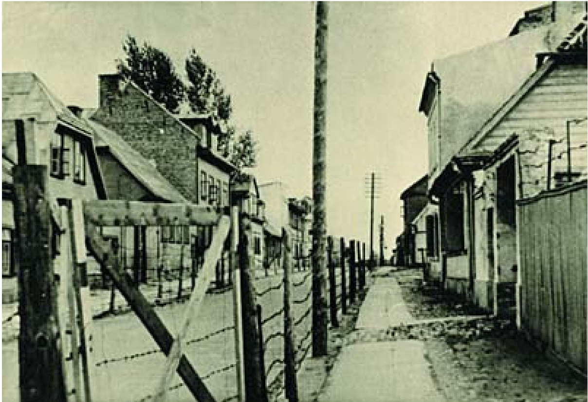
Straßen des Ghetto in Riga